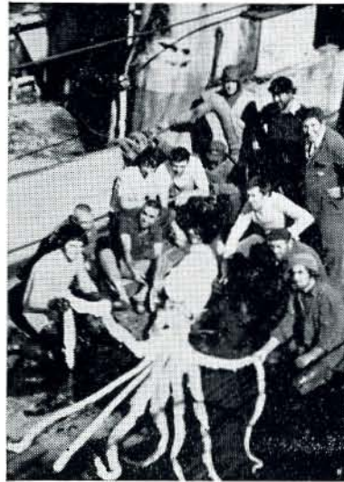
Un calamar gigante capturado en Noruega